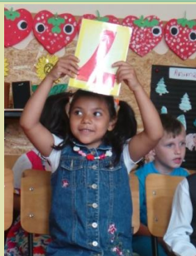
A HÉT FOTÓJA: Vidám előadás

Tanévzáró Az elmúlt héten véget ért a 2016-2017-es iskolai év. A gyerekek minden osztályban szép kis előadással készültek e napra. Csütörtökön 8 órakor volt a Szentjobb-i iskola évzárása, 10-től pedig a Csuha-i iskolások zárták le a tanévet.