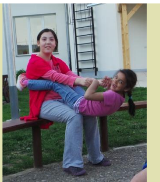
A HÉT FOTÓJA: Játék