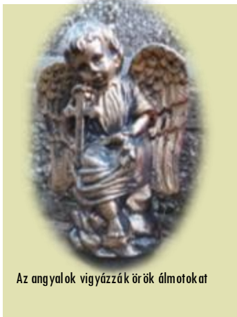
Az angyalok vigyázzák örök álmotokat